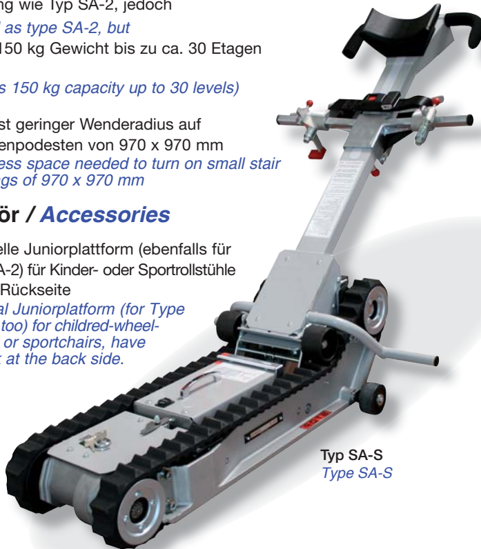
Typ SA-S Type SA-S

special Juniorplatform (for Type SA-2, too) for children-wheel-chairs or sportchairs, have a look at the back side.